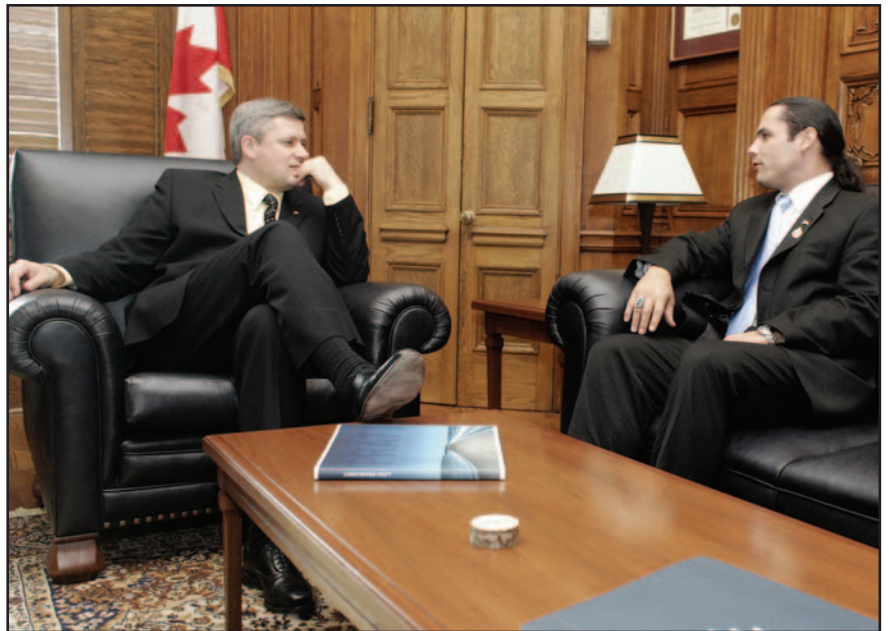
Le très honorable Stephen Harper rencontre avec le chef national, Patrick Brazeau, au sein de son cabinet sur la colline parlementaire

En même temps que ces réussites, nous avons rencontré de nouveaux défis. Dans l'esprit de l'accent mis sur la responsabilisation, le CPA a été le premier des organismes autochtones nationaux à subir un processus long et approfondi de